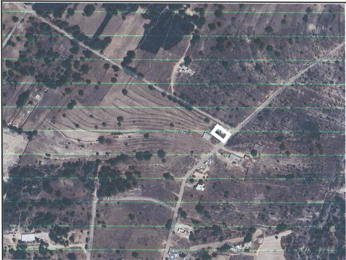
UBICACIÓN DE POZO

MUNICIPIO: Amaxac de Guerrero LOCALIDAD: Seccion Tercera OBRA: Suministro de material para banquetas en pozo de agua UBICACIÓN: Tanque de agua