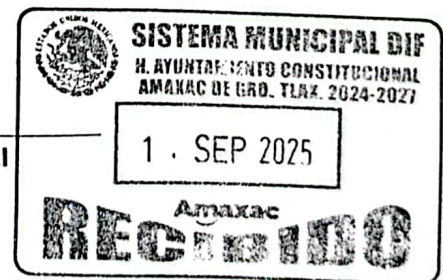
ALEXANDRA BAEZ MATLALCUATZI